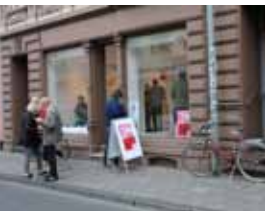
„en miniature“ im Projekt- raum EA71, parc/ours 2016

Im Projektraum EA 71 wird die Ausstellung „en miniature“ mit Werken der am parc/ours teilnehmenden c/o-Künstlerinnen und Künstler präsentiert. Besucher haben so die Möglichkeit, sich vor ihrem Rundgang einen Eindruck von den beteiligten KünstlerInnen zu verschaffen, sich zu orientieren und ihre Route zu planen. Die Kleinformatigen Werke können vorab bereits am 02. und 10. September im Kunstcaravan von Bernhard Jansen besichtigt werden.