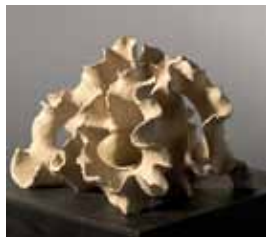
Soure, Teracotta, 39x50x40 cm

Die Werke von Wil Albertz präsentieren sich dem Betrachter als ein Abenteuer des Sehens. Die Herausforderung besteht darin, wahrzunehmen, wie die poetischen und konstruktiven Elemente jeweils miteinander agieren. Bei aller Vielfalt ihrer Gestalt haben die Arbeiten eines gemein: Sie ergründen die Spannweite der Modalitäten des Raums und liefern mit ihrer bewegten, plastischen Struktur gleichzeitig ein geeignetes Podium für die poetische Gestaltkraft des Lichts. (Dr. Liegl-Raditschnigg)