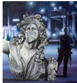
Shine on, 100x100cm, Acryl auf Leinwand, 2017

Michael Beckers benutzt als Grundlage seiner Malerei die Technik des Samplings, des Sammelns, Verwertens und Verfremdens von vorgefundenen Bildern, die von ihm zerlegt und wieder neu zusammengesetzt werden. Dabei konfrontiert er formal wie inhaltlich Unterschiedliches, es trifft z.B. Kunst auf Kitsch, Alltägliches auf Fremdes, Gegenwärtiges auf Historisches, wodurch völlig neue konzeptionell mehrdeutige Bilder entstehen.