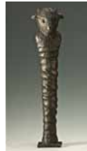
Janus 1 - Wolf und Schaf, Bronze, Höhe 44 cm, 2016