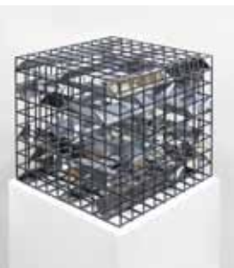
Spiegelkabinett, 28x28x28 cm, 2015