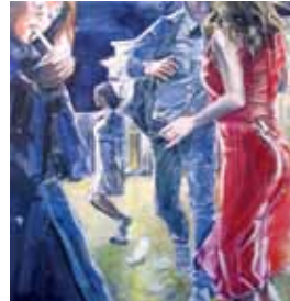
Freiheit, Acryl/Leinwand, 180x240 cm, 2017

Im Mittelpunkt steht das Erscheinungsbild des Menschen im Spiegel der Zeit und ihrer Gesellschaft. Den Hintergrund im Bild „Freiheit“ bildet der Alexanderplatz, Berlin ab, in historischer Platz, der Trennung, Wiederbegegnung, wiedergewonnene Freiheit und die Gefahr, diese wieder zu verlieren widerspiegelt. Ängste und Hoffnung prägen das Bild unter dem Eindruck des pulsierenden Lebens und einer rastlosen Eile der Protagonisten, die Anonymität ausstrahlen.