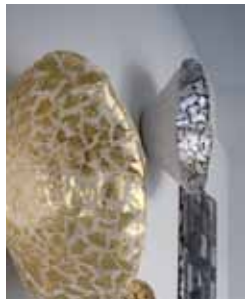
„Rise and Shine“, Blattgold auf Leinwand, ca. 60 cm Durchmesser, 2017

Ora Avitals Werke zeichnen sich durch eine unbändige Energie und Expressivität aus. In der Magie des Moments spielen Materialität und Eigenwert von Silber und Gold eine zentrale Rolle. Teilweise entwickelt die Bildende Künstlerin die Formvorstellungen ihrer Arbeiten aus den Materialien heraus und lässt sie, durch die Hervorhebung ihrer charakteristischen Eigenschaften, ihre volle Wirkung entfalten.