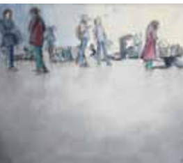
Irritation, Öl auf Leinwand, 70x90 cm, 2016

„Ein seit der Postmoderne völlig verändertes Weltbild führt zu mehr Freiheit (ästhetisch, ethisch, politisch, sozial) aber auch zu mehr Unsicherheit. Wir befinden uns in einer Auflösung alter Werte, einer destabilisierten Situation. Die Malerei ist für mich eine existenziell wichtige Möglichkeit, mich mit der Realität auseinander zu setzen. Der medialen Informationsflut setze ich das haptische, körperhafte und handwerklich erarbeitete Bild entgegen.“