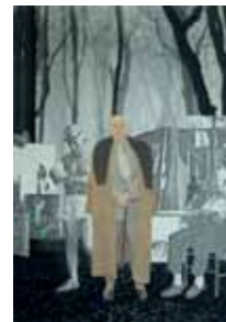
Atelierbesuch, Papierkollage, 27,5x21,5 cm, 2017

„Bilder und Grafiken mit Bezug zur Malerei und Kulturgeschichte sind in dieser Atelierausstellung mein Leitthema, das sich zwischen Fakt und Fiktion bewegend, zeit- und raumübergreifende (Be-)Deutungszusammenhänge erfahrbar macht.“