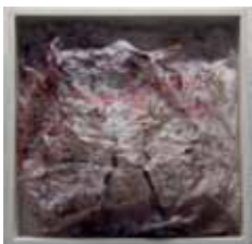
O.T., Acryl auf Folie im Holzkasten, 40x40 cm, 2016

Im Mittelpunkt der Arbeiten von Rita Wilmesmeier steht die Frage nach dem Dahinter, dem Verborgenen. Zuerst entsteht das Bild, abstrakt oder realistisch. Anschließend wird das Dargestellte überlagert, verwischt oder verhüllt, aber nicht unkenntlich gemacht. Dadurch entstehen Illusionen und Spannungsfelder, auf die der Betrachter sich einlassen muss. Ihre Techniken und Materialien sind unterschiedlich angelegt und überraschen in ihrer Vielseitigkeit.