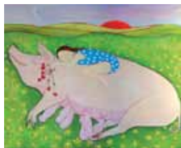
Muttersau, Öl auf Leinwand, 2017

Menia zeigt in ihrem Atelier neuentstandene Arbeiten.