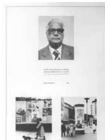
Dimitrijevic Braco, „Passant den ich zufällig traf“, (1975)