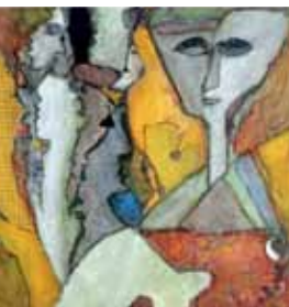
Neben Ein Ander - side by side side, 20x20x4 cm, 2017