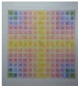
Aquarell, 70x70 cm, 2017

Lothar Zeuch zeigt Arbeiten, welche die unendliche Vielfalt an Möglichkeiten erahnen lassen, die sich aus der Beschäftigung mit dem Verhalten von Struktur zu Farbe ergeben und sich dem Reichtum optischer Erlebnisse hinzufügen lassen.