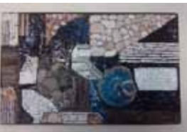
M. Hilgers, Mosaik, 50x80 cm, 2010

Marianne Hilgers malt mit Natur- und Glassteinen. Sie setzt die verwendeten Mineralien ohne Vorzeichnung und schafft keine plane Fläche. Vielmehr schafft sie bewegte Strukturen, die der Fantasie freien Raum lassen.