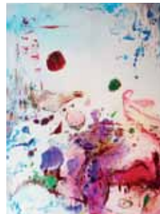
Exploration, Aquarell/Acryl auf Leinwand, 120x100 cm, 2017

„Malerei ist mehr als ‚nur‘ Malerei. Sie ist vergeistigter Ausdruck und Ergebnis der Interaktion zwischen dem Künstler und der ihn umgebenden Wahrnehmung von Natur- und Welterscheinung. Jeder Augenblick, ja jeder Zustand seiner Betrachtung ist von ungeheurem Wert und verweist auf etwas Unbekanntes, vielleicht Jenseitiges. Der Maler wird so zum Vermittler und öffnet dem Betrachter seiner Bilder die Möglichkeiten eigener Deutung und der Anmutung von Realität.“