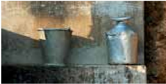
Dieter Nuhr, Bali Stillleben, 2008

der eigenen alltäglichen Erfahrungswelt heraus in fremde Länder und Kulturen. Sie zeigen das Fremde, das Detail, das exemplarisch für das große Ganze steht.