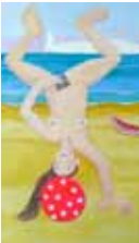
Menia, Kamasutra Solo