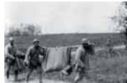
Walter Kleinfeldt, Soldaten beim Transport eines Verwundeten, 1917

den monatelangen Grabenkrieg und fotografiert diesen mit einer einfachen Plattenkamera: Bis zum Ende des Krieges entstehen rund 150 Fotografien, etwa 100 haben die Zeit überdauert.