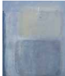
Ingrid Pusch, Über sieben Brücken

25.05. bis 08.06. Alleine die Farbe ist das gestaltende Element in den Arbeiten von Ingrid Pusch. Völlig gegenstandslos, aber nicht expressiv tritt sie in Erscheinung. Die Bilder strahlen eine gewisse meditative Ruhe aus und laden zum Verweilen des Blickes ein. Eröffnung 11.30