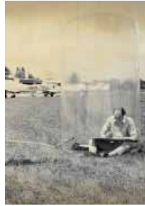
Mobiles Büro, 1969

menschlichen Handelns in Räumen und Situationen. In ‚Alles ist Architektur‘ betrachtet das Museum Abteiberg den Entwerfer dieses Museums, den Wiener Architekten, Designer, Künstler, Publizisten und Kurator Hans Hollein anlässlich seines