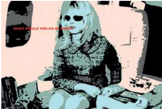
Anne-Mie van Kerckhoven, What would you do in Orbit?, 1964, Siebdruck