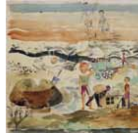
Am Meer um 1920, Aquarell über Bleistift