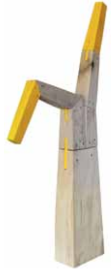
Gunther Hüls Witt, Bewegungsimpuls, 81x40x9 cm, 2016