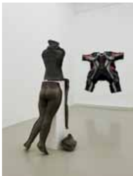
»Hartschalenkomplott«, 2016, Polyesterharz, Schrauben, Dreck, Knochen dahinter: Stretch 2016, Motorradkombi

entwickelte große ortsspezifische Interventionen, die das Zusammenspiel von Mensch und Maschine sowie Figur oder Roboter im Raum beleuchten. Rund sechzig Arbeiten werden im Museum Abteiberg zu sehen sein, verteilt im großen Wechselausstellungsraum und dem offenen Ausstellungsbereich in der Straßenebene. Die Ausstellung wird gemeinsam mit dem Kunstverein in Hannover realisiert.