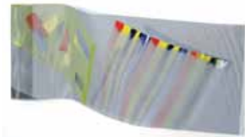
(Werk-Nr. 6/2017) Ohne Titel, 2017, Acryl auf Stahl, ca. 40x80x30 cm