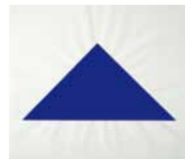
Palermo, Blaues Dreieck, 1969, Auflagenobjekt mit Gouache

15.10. bis 17.12. Die Galerie Löhrl zeigt in Auflagen erschienene Arbeiten des Malers Blinky Palermo (1943-1977). Eröffnung 16 Uhr Mit einem Werk Palermos befasst sich auch Morgan Fisher in der Ausstellung „Translations“ im Museum Abteiberg (siehe dazu S. 4).