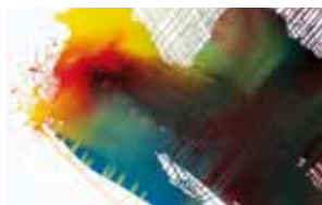
Andreas Blum, o.T., 2010

Zum ersten Mal wird der „Kunstpreis Ennepe-Ruhr“ ausgeschrieben. Die Jury hat 20 Künstler/innen nominiert und für diese Wanderausstellung ausgewählt.