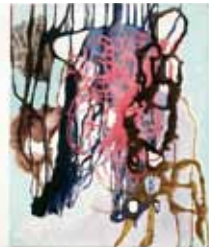
B. Schilling, Malerei 2010

26.11. bis 18.12. Eröffnung 19.30 Uhr Bertram Schilling wurde 1971 in Krumbach geboren, studierte Malerei an der Kunsthochschule Kassel, an der Kunstakademie in München und an der Hochschule für Gestaltung in Karlsruhe. Im Kunstverein zeigt er Bilder aus seiner aktuellen Werkphase sowie erstmals kleinformatige Collagen.