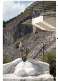
Speculum, Fotografie 80 x 120 cm

02. bis 09.10. Anlässlich seines 100-jährigen Bestehens und zum 100. Geburtstag von und Louise Bourgeois rief der „Verein 04.12. Düsseldorfer Künstlerinnen“ Künstlerinnen aus aller Welt auf, mitzufeiern bis 31.01. und ein Werk zu der Ausstellung im Düsseldorfer Nordpark und im Bonner Frauenmuseum beizusteuern.