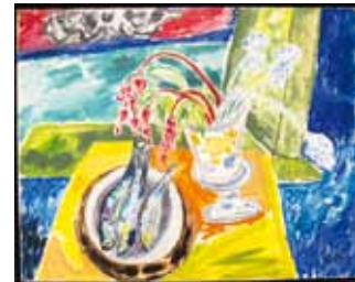
Stillleben mit Fischen, Öl auf Leinwand, signiert, 1926, Leihgabe aus Privatbesitz