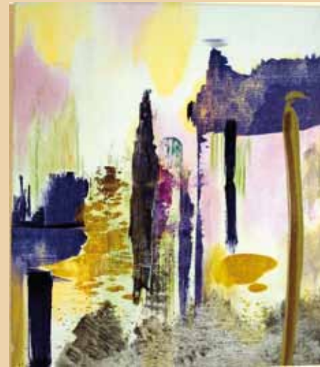
Arno Tillmanns, Am Wasser, 2005, Öl auf Leinwand, 70 x 60 cm

Trotz dieser Gleichwertigkeit entwickelt sich aus den dabei entstehenden Ebenen ein Raum von einer erstaunlichen Tiefe und spirituellen Qualität. Er bietet Platz für Interpretationen des Betrachters und erweitert sich zu einem unbekanntem, geheimnisvollen Bildraum, der sich quasi hinter dem Bild öffnet. So gewinnt Tillmanns Malerei eine dritte Dimension und lässt die Möglichkeiten malerischer Transzendenz erfahrbar werden.