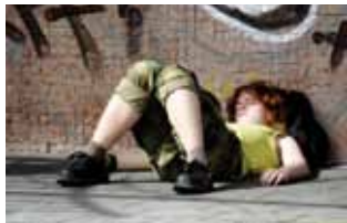
R. Kramer, Foto aus „Fußgängerzonen“

Gezeigt werden Fotografien der beiden Serien „Fußgängerzonen - Bilder aus Städten“ und „Unvergessen - Kleinstadtfriedhöfe im Rheinland und in Westfalen“.